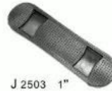
J 2503 1"