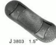
J 3803 1.5"