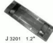
J 3201 1.2"