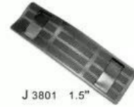
J 3801 1.5"