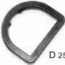
D 2512 1"