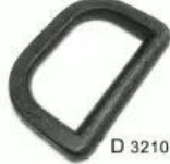
D 3210 1.2"