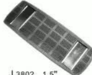
J 3802 1.5"