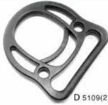
D 5109(2) 2"