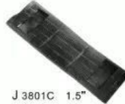
J 3801C 1.5"