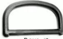
D 5110 2"