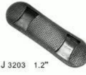
J 3203 1.2"